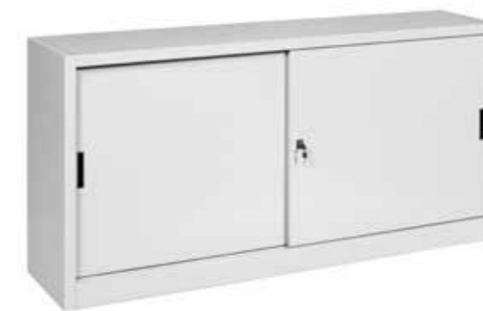
● MG9950 • l. 1500 / p. 450 / h. 880 MG9980 • l. 1800 / p. 450 / h. 880 portata per ripiano | shelf load capacity | charge par étagère : 60 kg Sopralzo con ante scorrevoli, divisorio verticale e 2 ripiani interni. Top cabinet with sliding doors, vertical partition and 2 internal shelves | Armoire basse avec porte coulissante, séparation verticale et 2 étagères internes.