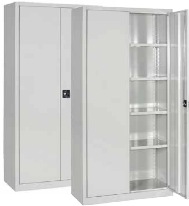
● MG9700 • l. 1000 / p. 450 / h. 2000 Armadio con ante a battente e 4 ripiani interni. Composable closet, with hinged doors, 4 shelves. | Armoire modulaire, avec portes battantes, avec 4 étagères. portata per ripiano | shelf load capacity | charge par étagère : 60 kg