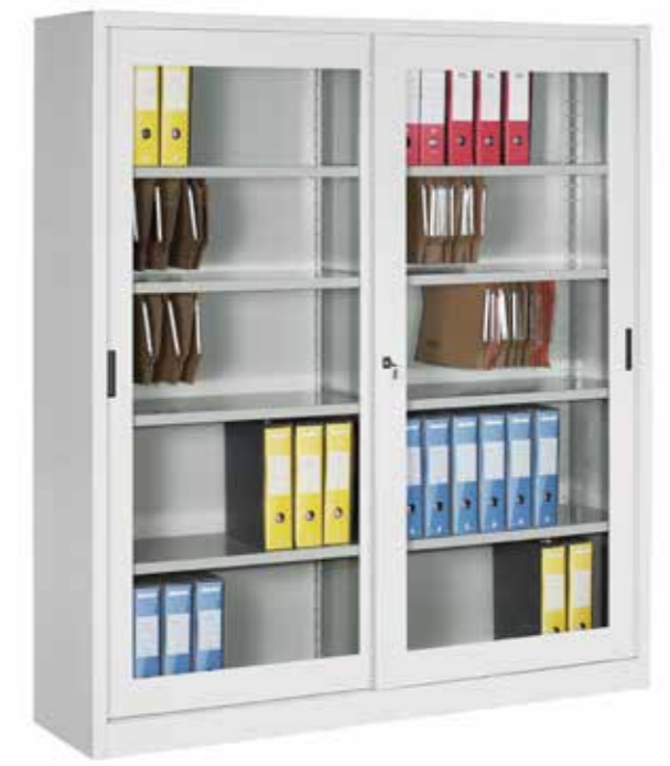
● MG9881 • l. 1800 / p. 450 / h. 2000 Armadio con ante scorrevoli in vetro temperato, divisorio verticale e 4 ripiani interni. Closet with tempered glass, sliding doors, vertical partition and 4 shelves. | Armoire avec portes coulissantes, en verre trempé, à compartiment vertical, 4 plateaux. portata per ripiano | shelf load capacity | charge par étagère : 60 kg