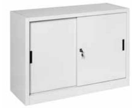
● MG9920 • l. 1200 / p. 450 / h. 880 Sopralzo con ante scorrevoli e 1 ripiano interno Top cabinet with sliding doors and one internal shelf | Armoire basse avec porte coulissante et étagère interne portata per ripiano | shelf load capacity | charge par étagère : 60 kg