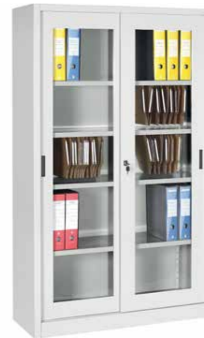
● MG9821 • l. 1200 / p. 450 / h. 2000 Armadio con ante scorrevoli in vetro temperato e 4 ripiani interni. Closet with tempered glass, sliding doors and 4 shelves. | Armoire avec portes coulissantes, en verre trempé, 4 plateaux. portata per ripiano | shelf load capacity | charge par étagère : 60 kg