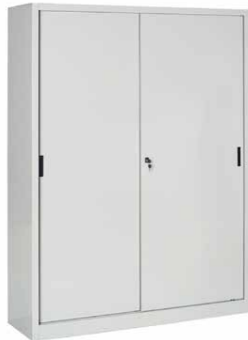
● MG9850 • l. 1500 / p. 450 / h. 2000 Armadio con ante scorrevoli, divisorio verticale e 8 ripiani interni. Composable closet, with hinged doors, vertical module and 8 shelves. | Armoire modulaire, portes battantes, à compartiment vertical, avec 8 étagères. portata per ripiano | shelf load capacity | charge par étagère : 60 kg