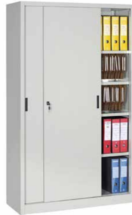
● MG9820 • l. 1200 / p. 450 / h. 2000 Armadio con ante scorrevoli e 4 ripiani interni. Composable closet, with sliding doors, 4 shelves. | Armoire modulaire, avec portes coulissantes, avec 4 étagères. portata per ripiano | shelf load capacity | charge par étagère : 60 kg