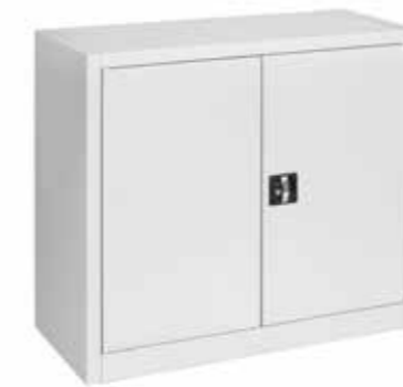
● MG9790 • l. 1000 / p. 450 / h. 880 Sopralzo con ante a battente e 1 ripiano interno Top cabinet with swing doors and 1 internal shelf | Armoire basse avec porte battant et étagère interne portata per ripiano | shelf load capacity | charge par étagère : 60 kg