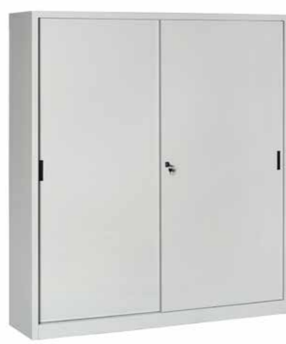
● MG9880 • l. 1800 / p. 450 / h. 2000 Armadio con ante scorrevoli, divisorio verticale e 8 ripiani interni. Composable closet, with sliding doors, vertical module and 8 shelves. | Armoire modulaire, portes coulissantes, à compartiment vertical avec 8 plans. portata per ripiano | shelf load capacity | charge par étagère : 60 kg