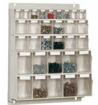
● MG386 Telaio metallico pensile con composizione di: 1 MG384, 2 MG383, 2 MG382 Assemblage: 1 MG384, 2 MG383, 2 MG382 | Assemblage de: 1 MG384, 2 MG383, 2 MG382 1.600 / p. 163 / h. 730