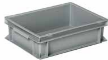
● MG370 Cassetta per magazzino e trasporto Box for warehouse and transport | Boîte pour stock et transport 1.400 / p. 300 / h. 120