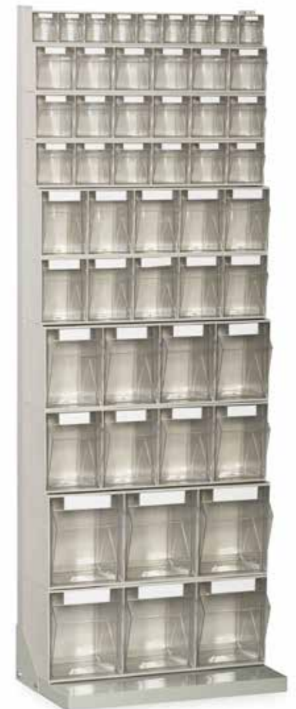
● MG385 Telaio metallico con composizione di: 1 MG384, 3 MG383, 2 MG382, 2 MG381, 2 MG380 Assemblage: 1 MG384, 3 MG383, 2 MG382, 2 MG381, 2 MG380 | Assemblage de: 1 MG384, 3 MG383, 2 MG382, 2 MG381, 2 MG380 1.600 / p. 330 / h. 1700