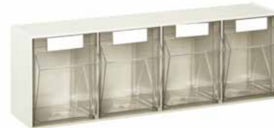
● MG381 Contenitore porta minuterie a 4 caselle Odds-and-end-holder container with 4 compartments | Conteneur porte- menuiserie à 4 boîtes 1.600 / p. 137 / h. 208