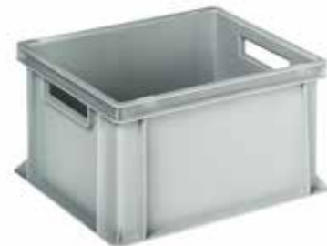
● MG371 Cassetta per magazzino e trasporto Box for warehouse and transport | Boîte pour stock et transport 1.400 / p. 300 / h. 220