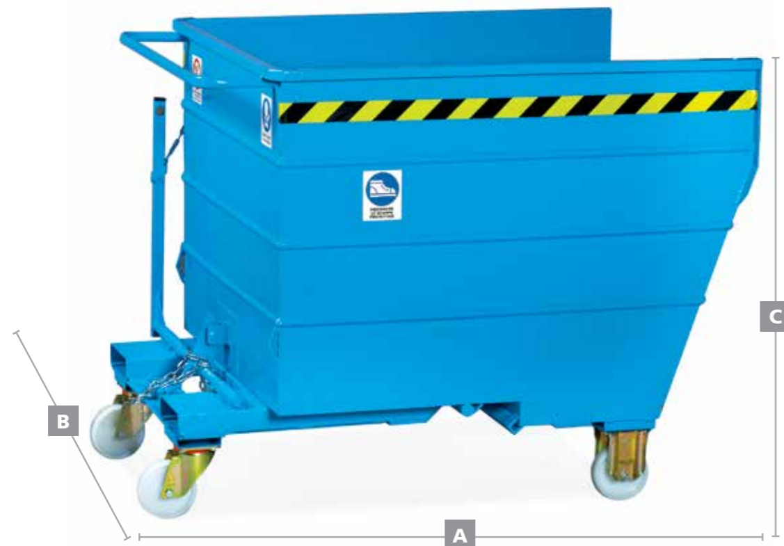
● MG353 Contenitore ribaltabile con ruote Ø 150 (2 fisse e 2 girevoli) portata kg. 1700 – capacità lt. 1000 Tip-up container on wheels Ø 150 (2 fixed wheels and 2 revolving) capacity kg. 1700 - capacity lt. 1000 Benne basculante sur roues diam. 150 (2 fixes et 2 pivotantes). Charge kg. 1700 Capacité lt. 1000 A 1500 (l.) / B 1070 (p.) / C 1210 (h.)

Scatole di inforcazione l. 170 / h. 50 mm