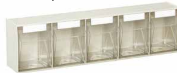
● MG382 Contenitore porta minuterie a 5 caselle Odds-and-end-holder container with 5 compartments | Conteneur porte- menuiserie à 5 boîtes 1.600 / p. 110 / h. 160