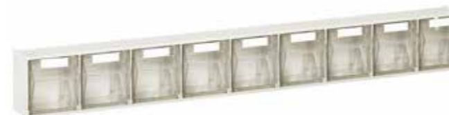
● MG384 Contenitore porta minuterie a 9 caselle Odds-and-end-holder container with 9 compartments | Conteneur porte- menuiserie à 9 boîtes 1.600 / p. 51 / h. 75