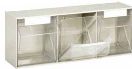
● MG380 Contenitore porta minuterie a 3 caselle Odds-and-end-holder container with 3 compartments | Conteneur porte- menuiserie à 3 boîtes 1.600 / p. 163 / h. 243