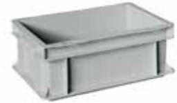
● MG369 Cassetta per magazzino e trasporto Box for warehouse and transport | Boîte pour stock et transport 1.300 / p. 200 / h. 120

Plastic containers | Conteneurs en plastique