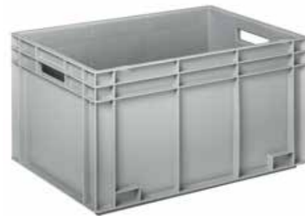
● MG373 Cassetta per magazzino e trasporto Box for warehouse and transport | Boîte pour stock et transport 1.600 / p. 400 / h. 340