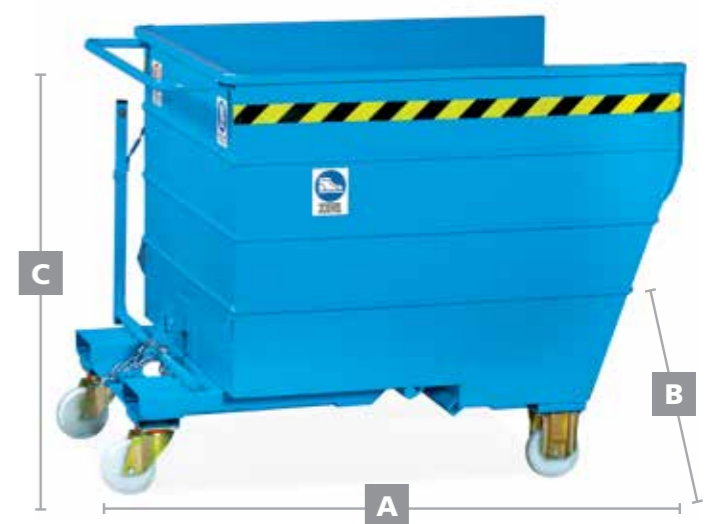
● MG352 Contenitore ribaltabile con ruote Ø 150 mm. (2fisse e 2 girevoli) portata kg. 1350 – Capacità 750 lt Tip-up container on wheels Ø 150 (2 fixed wheels and 2 revolving) capacity kg. 1350 – Capacity 750 lt Benne basculante sur roues diam. 150 (2 fixes et 2 pivotantes). Charge kg. 1350 Capacité lt. 750 A 1300 (l.) / B 1070 (p.) / C 1030 (h.)