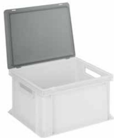
● MGC370 Coperchio per MG370 e MG371 Lid for MG370 and MG371 | Couvercle pour MG370 et MG371 1.400 / h. 300