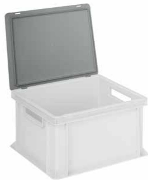
● MGC374 Coperchio per MG372 e MG373 Lid for MG372 and MG373 | Couvercle pour MG372 et MG373 1.600 / h. 400