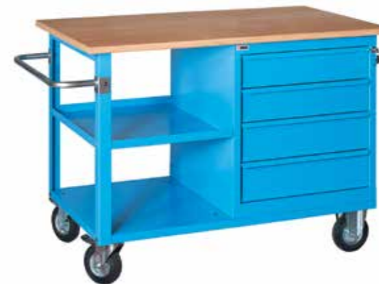
● XLM 120 01 • 1.1200 / p. 700 / h. 905 • Portata kg. 450 Banco da lavoro su ruote (Ø 150), con cassettiera a 4 cassetti (2 da 125 mm e 2 da 150 mm) e vano a giorno con ripiano fisso. Workbench on wheels (Ø 150), with drawer unit that includes 4 drawers (2 drawers 125 mm and 2 drawers 150 mm) and open com- partment with fixed shelf. Load capacity 450 kg | Etabli sur roues (Ø 150), avec une caisson à tiroirs composée de 4 tiroirs (2 de 125 mm et 2 de 150 mm) et compartiment à jour avec étagère fixe. Charge 450 kg