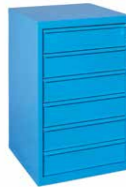
● XL 100 61 • 1.600 / p. 620 / h. 1000 Cassettiera a 6 cassetti (H 150 mm.) Closet with 6 drawers (H 150 mm.) | Armoires à 6 tiroirs (H 150 mm.)

Closets with drawers | armoires à tiroirs