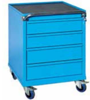
● XLR 65 41 • 1.600 / p. 620 / h. 815 Cassettiera su ruote a 4 cassetti (2 H 125 mm, 2 H 150 mm) Closet on wheels with 4 drawers (2 H 125 mm, 2 H 150 mm) | Caisson sur roues a 4 tiroirs (2 H 125, 2 H 150 mm)