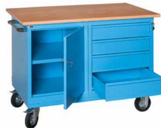
● XLM 120 02 • 1.1200 / p. 700 / h. 905 • Portata kg. 450 Banco da lavoro su ruote (Ø 150), con cassettiera a 4 cassetti (2 da 125 mm e 2 da 150 mm) e vano chiuso da anta e con ripiano interno regolabile. Workbench on wheels (Ø 150), with drawer unit that includes 4 drawers (2 drawers 125 mm and 2 drawers 150 mm) and closed compartment with door and adjustable inside shelf. load capacity 450 kg | Etabli sur roues (Ø 150), avec une caisson à tiroirs com- posée de 4 tiroirs (2 de 125 mm et 2 de 150 mm) et compartiment fermé par une porte et avec étagère réglable. Charge 450 kg