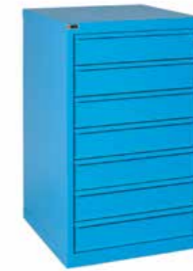
● XL 100 71 • 1.600 / p. 620 / h. 1000 Cassettiera a 7 cassetti (H 125 mm.) Closet with 7 drawers (H 125 mm.) | Armoires à 7 tiroirs (H 125 mm.)